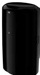
Hulladékgyűjtő tetővel (B1)